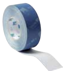
TESCON No. 1