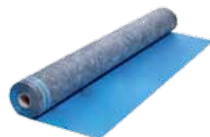
D.-L. T. POWER