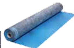
D.-L. T. POWER